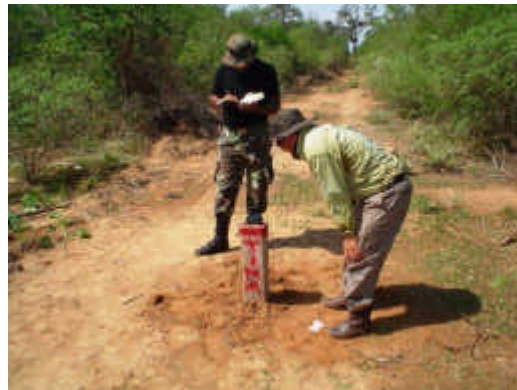
La delimitación física fue realizada por técnicos de la Fundación DeSdel Chaco.

La reserva natural Cerro Cabrera-Timane, creada por Decreto del Poder Ejecutivo, está ubicada en el Departamento de Alto Paraguay, distrito de Fuerte Olimpo (ex Mayor Pablo Lagerenza), en la frontera norte con Bolivia, y constituye una de las áreas núcleo de la Reserva de la Biosfera del Chaco. Tiene una superficie de 125.061 Has con 4.274 mts 2 y se caracteriza por la belleza de su paisaje, única en el país, limitada por una majestuosa barrera de acantilados, valles y cuencas.